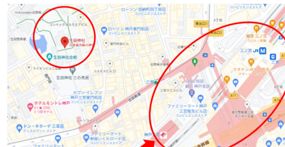
JR・阪急・阪神・地下鉄の駅が集まる兵庫県最大の繁華街