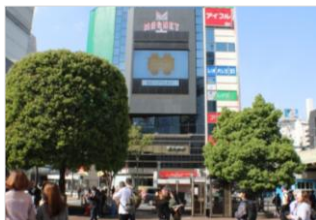
【渋谷】 109フォーラムビジョン 放映時間：9～24時