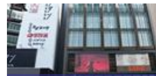
【吉祥寺】 吉祥寺フコク生命ビジョン 7～23時