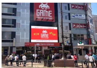
【池袋】 池袋TS-VISION 放映時間：10～24時