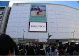
【池袋】 池袋パルコビジョン 放映時間：8時～23時