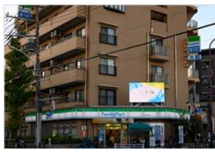
【狛江】 狛江三叉路ビジョン 放映時間：7～20時