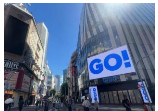
【池袋】 GiGOビジョン池袋 放映時間：8～23時