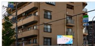
【狛江】 狛江三叉路ビジョン 7～20時