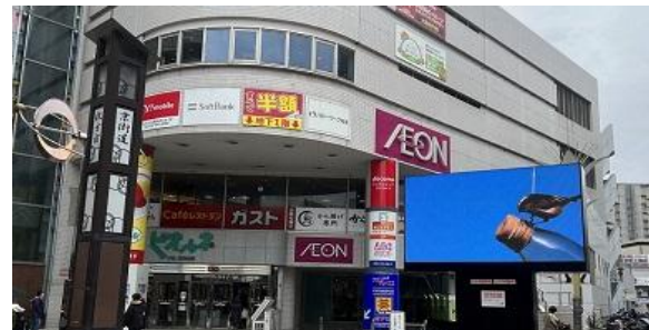
【枚方】 枚方ビオルネビジョン 放映時間：7～21時