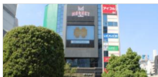
【渋谷】 109フォーラムビジョン 9～24時