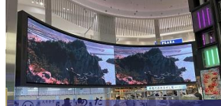
【心斎橋】 心斎橋ハルコビッグビジョン 10～23時