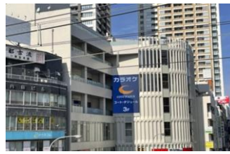
【本八幡】 本八幡駅前ビジョン 7～22時 ※無音