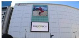
【池袋】 池袋ハルコビジョン 8時～23時