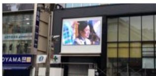
【新宿】 NEWNO・GS新宿ビジョン 7～24時