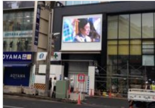
【新宿】 NEWNO・GS新宿ビジョン 放映時間：7～24時