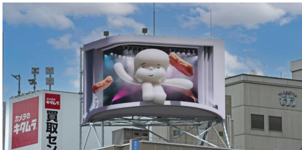
【梅田】 dipビジョン 放映時間：7～23時