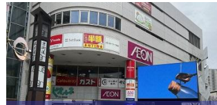
【枚方】 枚方ビオルネビジョン 7～21時