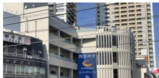
【本八幡】 本八幡駅前ビジョン 7～22時※無音