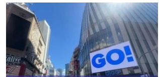
【池袋】 GIGOビジョン池袋 8～23時