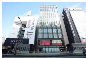
【吉祥寺】 吉祥寺フコク生命ビジョン 放映時間：7～23時