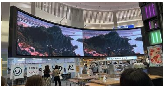
【心齋橋】 心齋橋パルコビッグビジョン 放映時間：10～23時