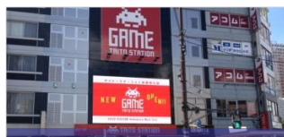
【池袋】 池袋TS-VISION 10～24時